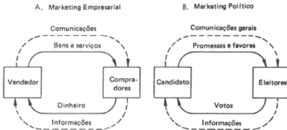
Figura 1: Comparação do marketing empresarial e do marketing político

"Esquemáticamente", escreve (Kotler (1978), "os processos estruturais do marketing empresarial e do político são basicamente os mesmos. Ambos poderão ser analisados em termos da teoria de troca". A figura 01 ilustra a referida analogia.